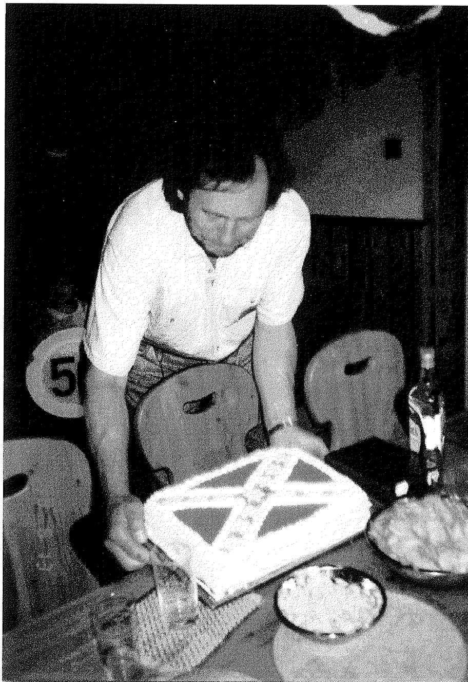
"The Grand Ole Southern Man"