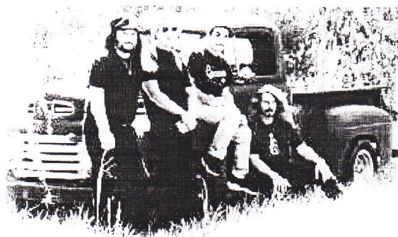
Randall Hall Band